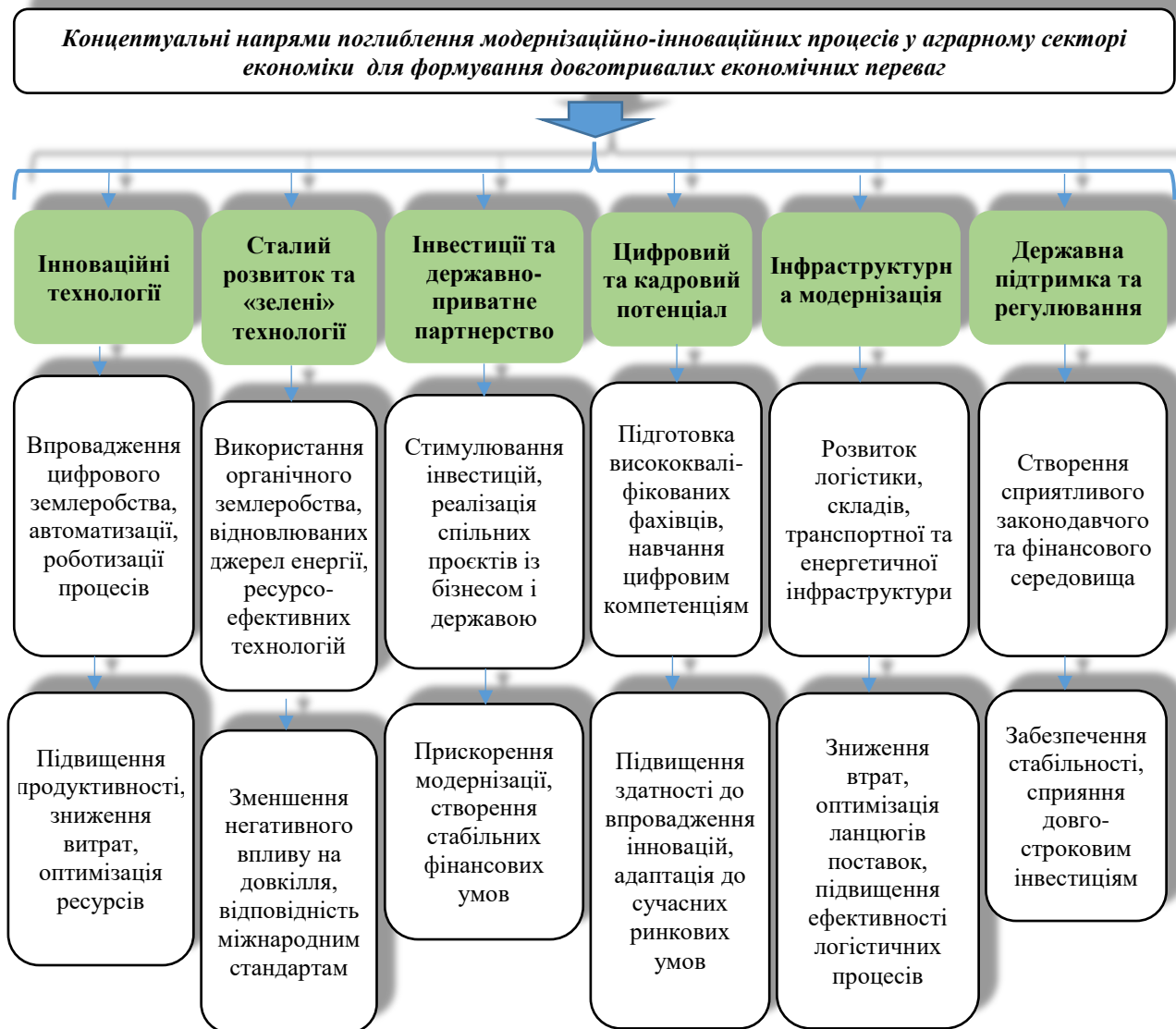
Рис. 3. Стратегічні вектори оптимізації модернізаційних та інноваційних трансформацій аграрного сектору економіки з метою забезпечення стійкого економічного зростання

екологічної відповідальності для забезпечення стійкого економічного зростання та підвищення конкурентоспроможності сектору.