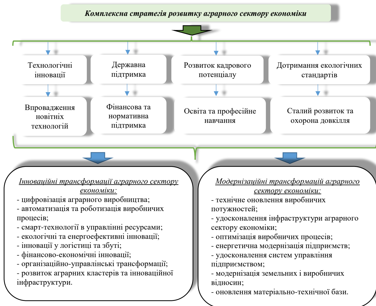
Рис. 1. Інтегрована стратегічна модель розвитку аграрного сектору економіки