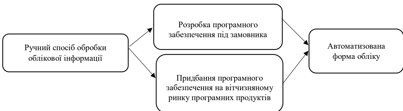
Рис. 2. Способи переходу на автоматизовану форму обліку

Для переходу на автоматизовану форму обліку в таких господарствах є два надійних способи (рис. 2).