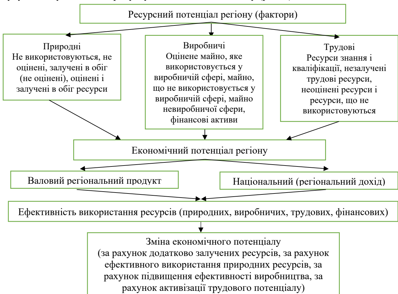
Рис. 2. Структура економічного потенціалу в системі забезпечення стійкості регіональної економіки

Необхідно мати на увазі, що зростання економічного потенціалу не відбувається, якщо це зростання екстенсивне або не містить еволюційного (або революційного) перетворення і розвитку чинників відтворення, зниження економічного потенціалу, навіть при деяких якісних покращеннях завжди є свідченням або причиною регресії процесу відтворення; економічний потенціал значною мірою залежить від досконалості господарського механізму та характеризується довготривалим соціально-економічним ефектом, приростом сукупного суспільного продукту і національного доходу (рис. 2).