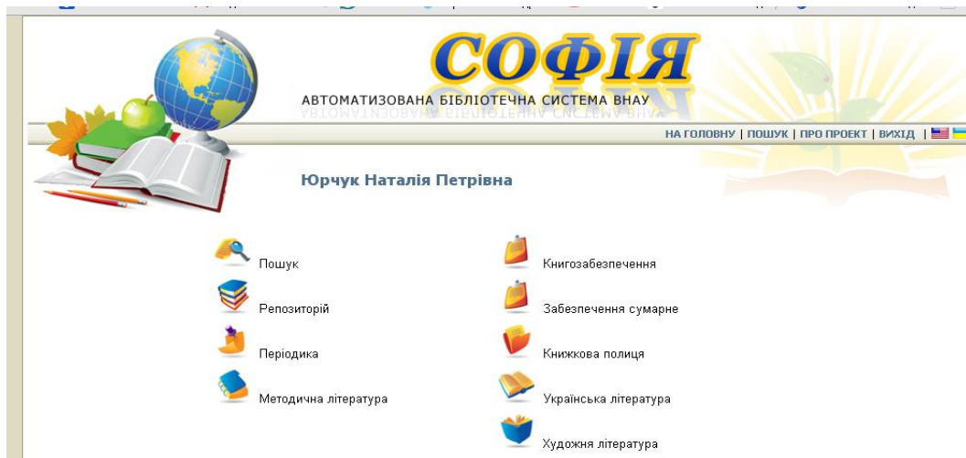
Рис. 4. Автоматизована бібліотечна система “Софія”