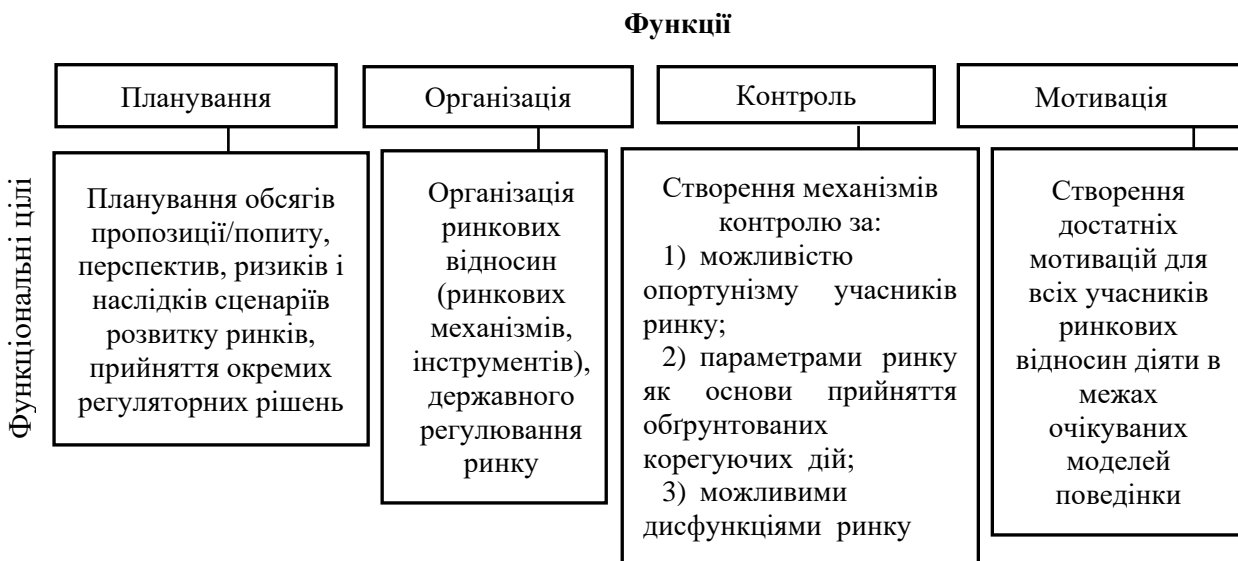
Рис. 1. Функції контрактації як системи управління процесом формування, функціонування та розвитку репрезентативного ринку

Звідси, як і будь-який регулятивний процес, по суті, контрактація є особливою управлінською системою, при реалізації якої повинні бути забезпечені класичні управлінські функції (рис. 1).