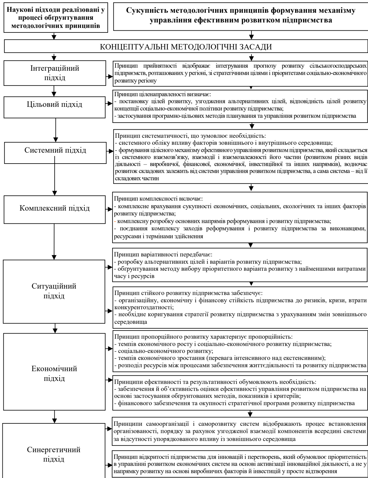
Рис. 1. Система концептуальних методологічних засад формування механізму управління ефективним розвитком підприємства*