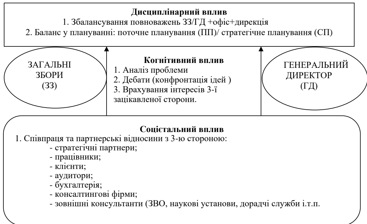
Рис.2. Трирівнева модель кооперативного управління