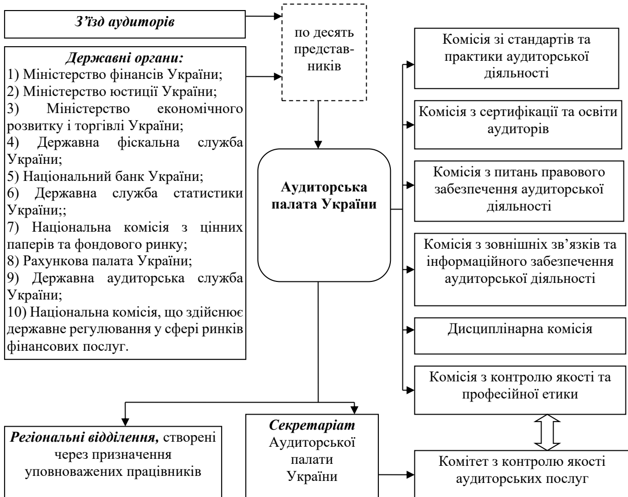
Рис. 2. Структурна схема Аудиторської палати України

зауважити те, що всі члени АПУ, окрім голови АПУ, займають вагомі посади поза межами АПУ. Виходячи з таких фактів, постає питання щодо належного рівня якості виконання такими комісіями своїх функціональних обов'язків, оскільки діяльність цих комісії контролює власне АПУ [9, с. 119].