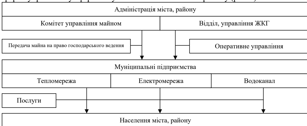
Рис. 4. Муніципальна форма управління у сфері послуг ЖКГ в межах регіону

У період 1990-х років у процесі приватизації відбулася передача об'єктів ЖКГ у підпорядкування муніципальних утворень. При цьому стала домінувати муніципальна форма управління у сфері послуг ЖКГ в межах кожного регіону (рис. 4).