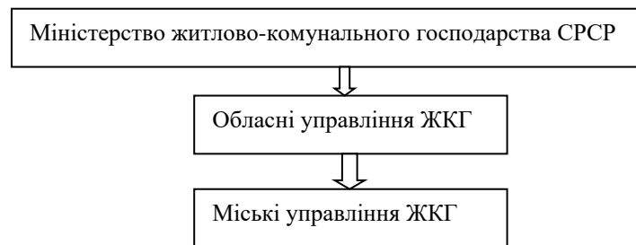
Рис. 3. Державна форма (вертикаль) управління ЖКГ

Державна форма управління у сфері послуг ЖКГ регіону була найбільш виражена та апробована в плановій економіці СРСР (рис. 3).