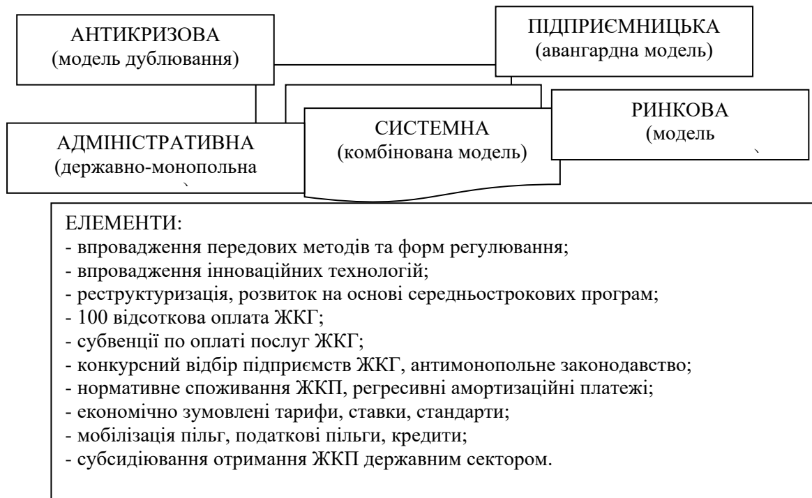
Рис. 2. Модель системного комбінування (МСК) управління розвитком ЖКГ

Пропонована нами класифікація механізмів управління у сфері послуг житлово-комунального господарства регіону на основі моделі системного комбінування (МСК) управління розвитком житлово-комунального господарства А. Б. Дьоміна досить умовна, оскільки антикризовий, підприємницький і адміністративний механізми в даний час працюють у ринкових (або близьких до них) умовах.