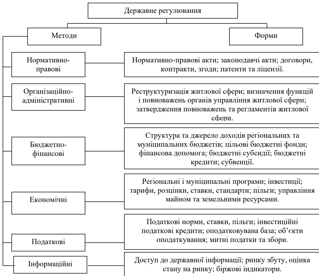
Рис. 1. Методи і форми державного регулювання у сфері послуг ЖКГ регіону

На рисунку 1 наведені методи і форми державного регулювання у сфері послуг ЖКГ регіону. Тобто кожна з форм управління у сфері послуг ЖКГ регіону (державна, муніципальна, приватна та змішана) за аналогією з державною має власний набір методів управління, які визначають специфічні форми управління всередині кожної з форм.