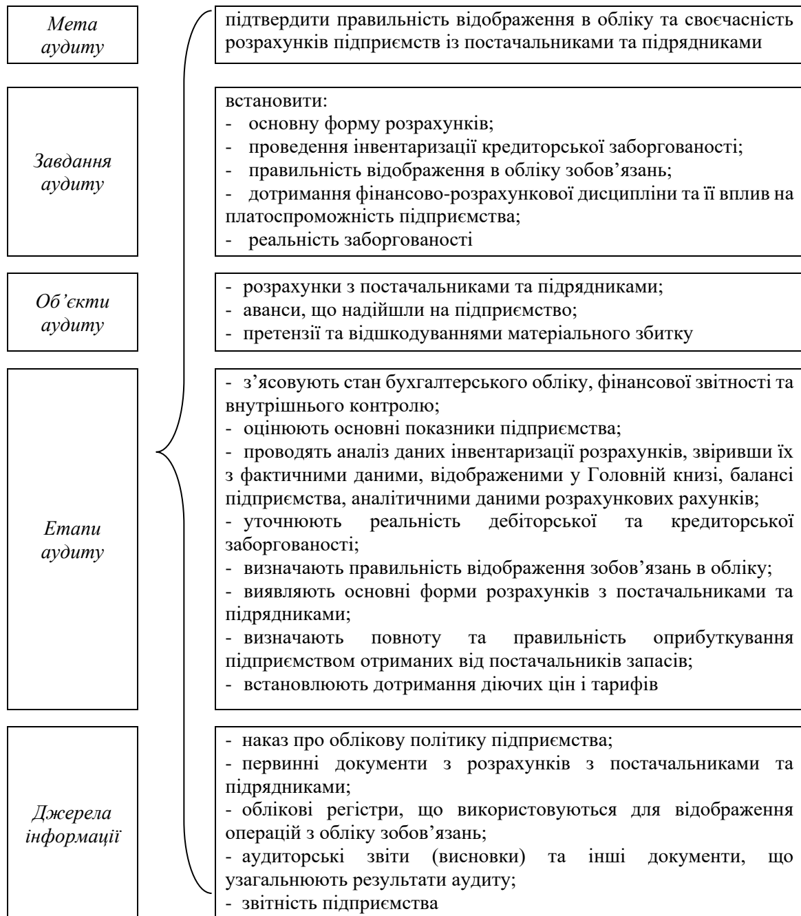
Рис. 1. Мета, завдання, об'єкти, етапи та джерела аудиту розрахунків з постачальниками та підрядниками

договорів на доставку запасів; повноти та своєчасності оприбуткування запасів, що надійшли від постачальників; достовірності та законності розрахунків з постачальниками; дотримання строків позовної давності [3, с. 341].