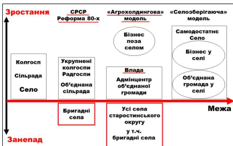
Рис. 3. Самоврядність і бізнес-активність сіл за різних моделей

Проте, запускаючи таку потрібну для України реформу самоврядності – децентралізації, Уряд ігнорував наукове забезпечення. Саме «сільська децентралізація» не отримала ні фундаментальних обґрунтувань, а ні модельної рамковості. Відтак одразу ж за базовою «розмитістю» проявились інтереси політизації процесу, і, що ще гірше в основному об'єднані територіальні громади почали формувати під землекористування великого агробізнесу. Станом на початок 2019 р. в середньому об'єднуються по 11 сіл, але більшість (55 %) з центрами у містах. Колишні райони розділяються на 1-3 громади. Ба більше, якщо Уряд дотримається власних планів по такому об'єднанню, то послідує об'єднання включатимуть вже по 62 села ((27900 – 9240) : (1172 – 884)). За таких умов про самоврядність селян, а відтак і про їх підприємницьку активність, на відміну від усього цивілізованого світу, Україна забуде.