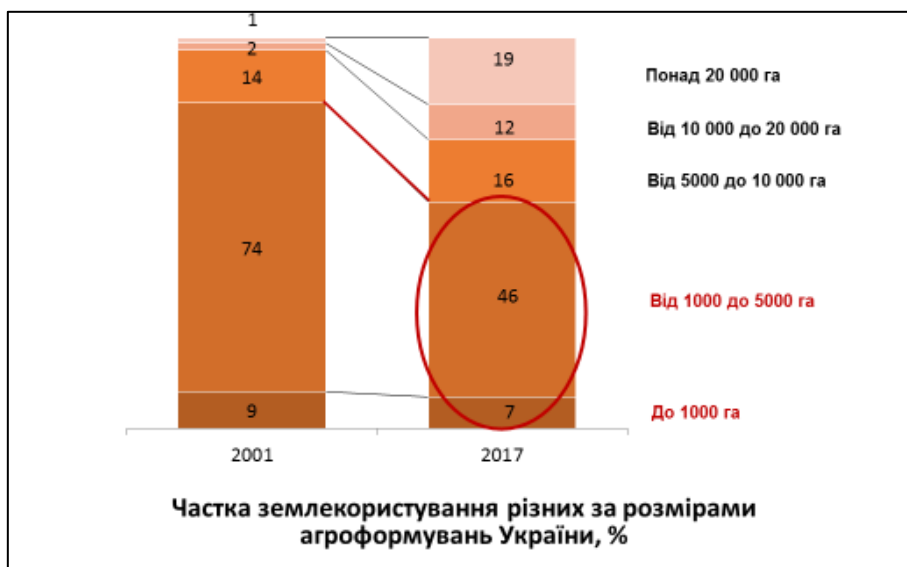
Рис. 2. Зміна структури сільськогосподарських товаровиробників за останні 16 років

Проте за однієї умови: він має «лягти» на інституційну зрілість до реформ самих селян. Ця умова вкрай важлива і для реформи форм господарювання. У селянства слід формувати проактивність до підприємництва: як до особистої справи, так і до контролю бізнесу у селі. Однак, підприємницьку «жилку» у селян неможливо сформувати без формування їх проактивності у самоврядності. За інституціональною теорією, теорією поведінкової економіки та нашими дослідженнями підприємницька організація є наслідковою від організації самоврядницької [14, 15].