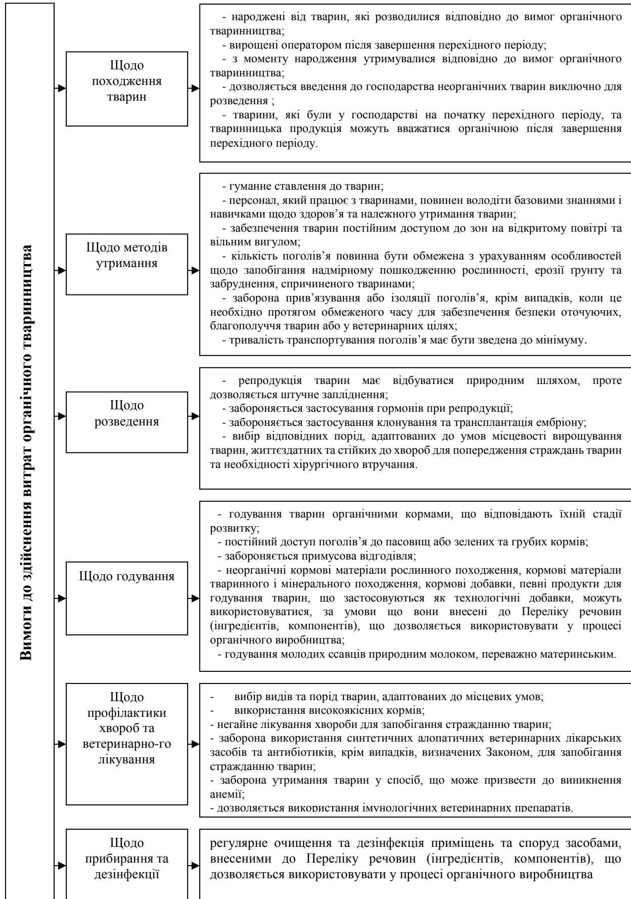
Рис. 3. Вимоги до виробництва продукції органічного тваринництва