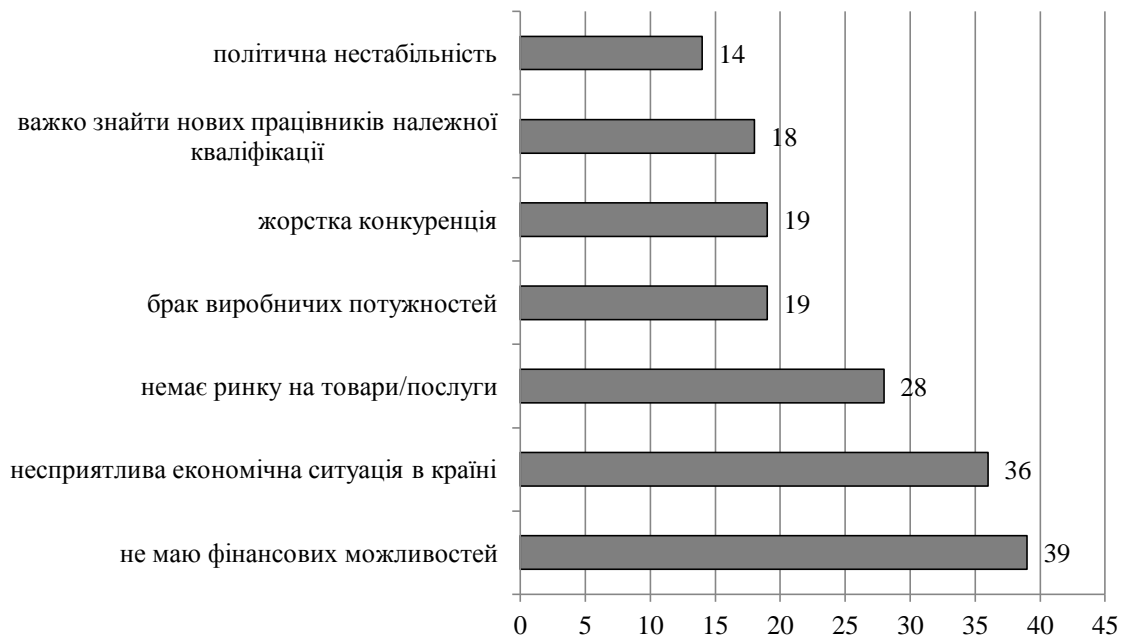
Рис.3. Перешкоди до розширення діяльності підприємств МСБ Вінницької області, %