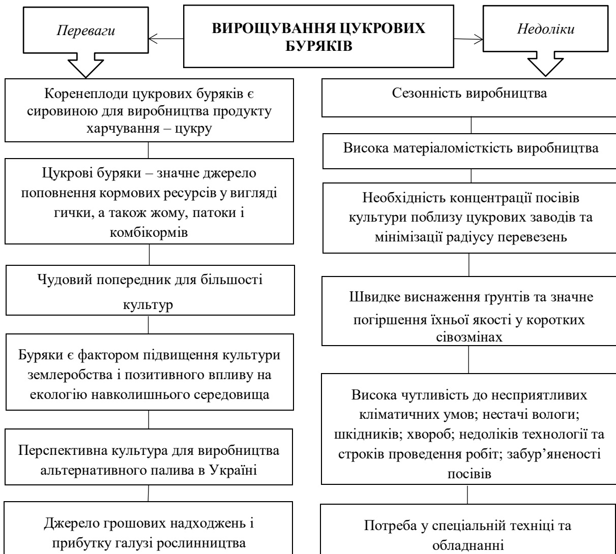
Рис. 1. Переваги та недоліки вирощування цукрових буряків

Вирощування цукрових буряків в Україні, як і все сільське господарство, – це високо ризиковане виробництво, яке має свої переваги та недоліки (рис.1).