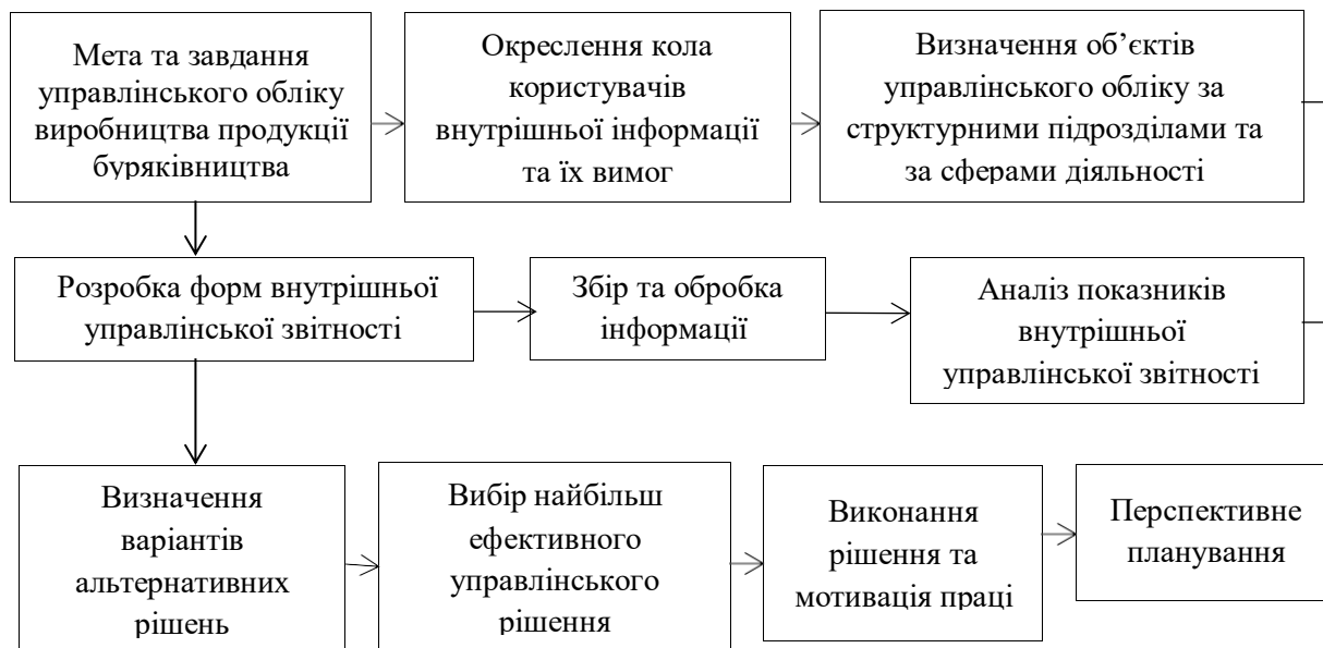
Рис. 4. Управління виробництвом продукції буряківництва підприємств мережі ІБКіЦБ НААН через систему впровадження управлінського обліку