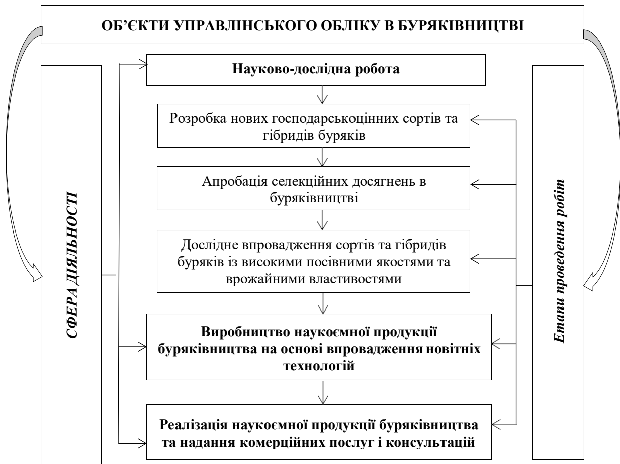
Рис. 5. Групування об'єктів управлінського обліку в буряківництві за сферами діяльності та за етапами проведення робіт установ та підприємств мережі ІБКіЦБ НААН