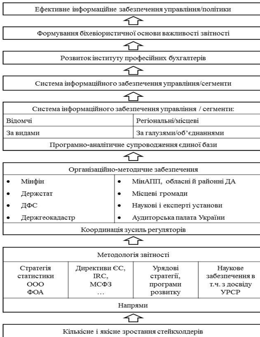
Рис. 3. Концептуальні положення розбудови системи обліково-інформаційного забезпечення управління

Науково-організаційне забезпечення розбудови нової системи інформаційного забезпечення управління базується і на з'ясуванні переліку споживачів звітності. До державних інституцій загальнодержавного, галузевого та регіонального рівнів кредиторів, науковців, аналітиків додаються асоціації виробників, місцеві громади, громадянське суспільство. Тобто варто враховувати кількісну і якісну їх розбудову, що в сучасному світі асоціюється з концепцією зростання стейкхолдерів (рис. 3).