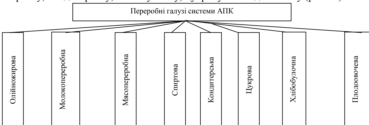
Рис. 1. Підгалузі переробної промисловості системи АПК Вінницької області

Підгалузі переробної промисловості системи АПК Вінницької області можна розділити на олійножирову, молокопереробну, м'ясопереробну, спиртову, кондитерську, цукрову та плодоовочеву (рис. 1.).