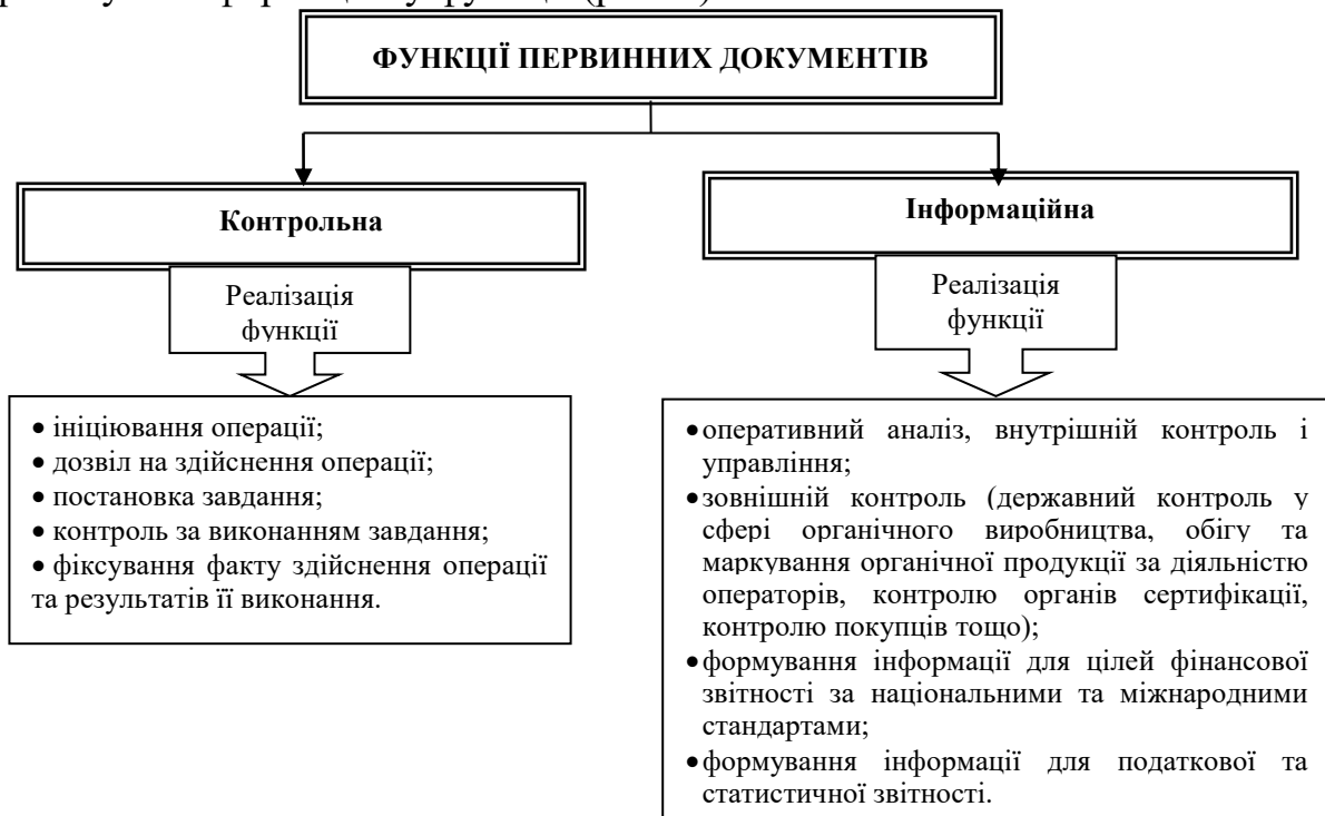
Рис. 2. Функції первинних документів в управлінні витратами виробництва органічної продукції

Тому кожен документ має бути детально продуманий та змодельований. У комплексі з визначеним переліком документів необхідно сформувати змістовну частину кожного документа, що досягається шляхом визначення необхідної інформації для забезпечення усіх напрямів її використання. За умови такого комплексного підходу, первинний документ виконуватиме контрольну та інформаційну функції (рис. 2).